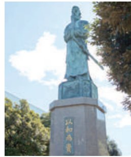
大前キャンパス内にある聖徳太子像