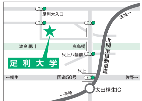
北関東自動車道太田桐生インターより5分