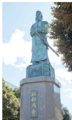
大前キャンパス内にある聖徳太子像