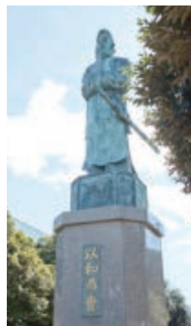
大前キャンパス内にある聖徳太子像

足利大学 アドミッションセンター 〒326-8558 足利市大前町268-1 ☎ 0120-62-9980